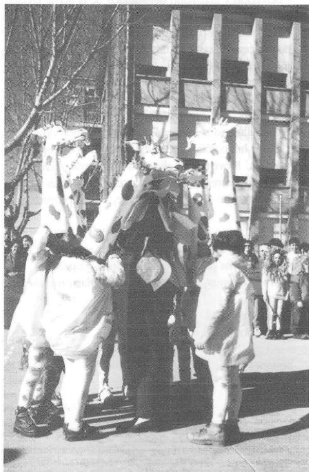
Hechos los ensayos previos, se preparan y ponen en escena las obras.

A lo largo del segundo y tercer trimestre se realizará una obra de teatro colectiva (con todos los alumnos del aula) en la que pondrán en práctica las técnicas aprendi-