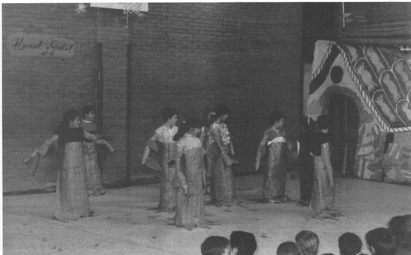
A lo largo del segundo y tercer trimestre se realizará una obra de teatro colectiva.

do hasta llegar allí. Estos episodios narrados son representados mediante pantomimas, música y efectos especiales, por un grupo de alumnos.