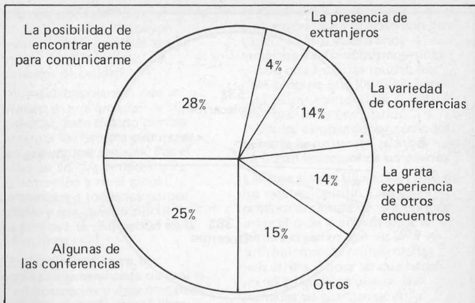
Cuadro 3. Motivo que te animó a asistir al Encuentro.